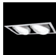
SLM DM Einbauleuchte