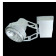
Vario Clip ST104