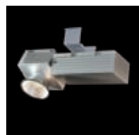
Powerline 3 SLM