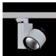
SLM DM Strahler